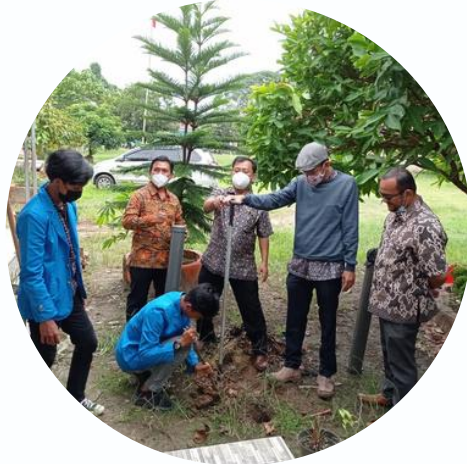
Pengembangan Kurikulum Berbasis Outcome Base Education (OBE)