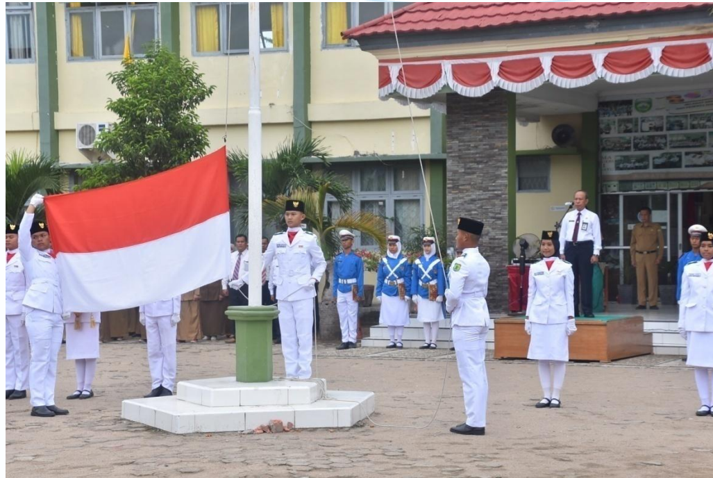
Sosialisasi ke SMA/SMK/MA di Kabupaten/Kota