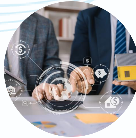
Peningkatan Penelitian dan PKM Dosen