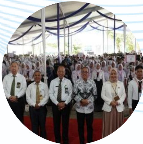
Peningkatan Animo Mahasiswa