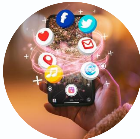
Live Streaming melalui Media Sosial Kampus