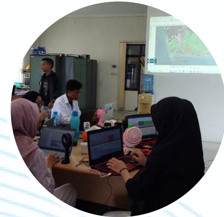
Penguatan Penjaminan Mutu