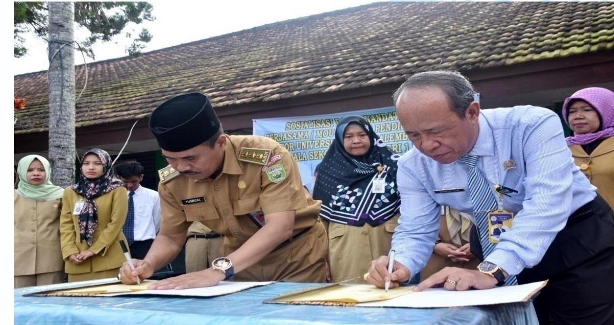
Penandatanganan MoU dengan Kepsek SMA/SMK/MA